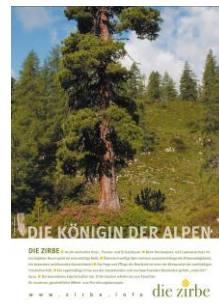
Die Königin der Alpen